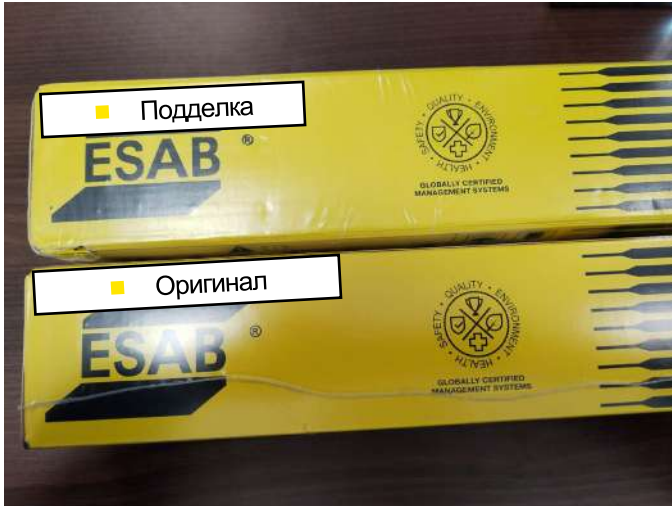
Подделка (один термоусадочный шов)