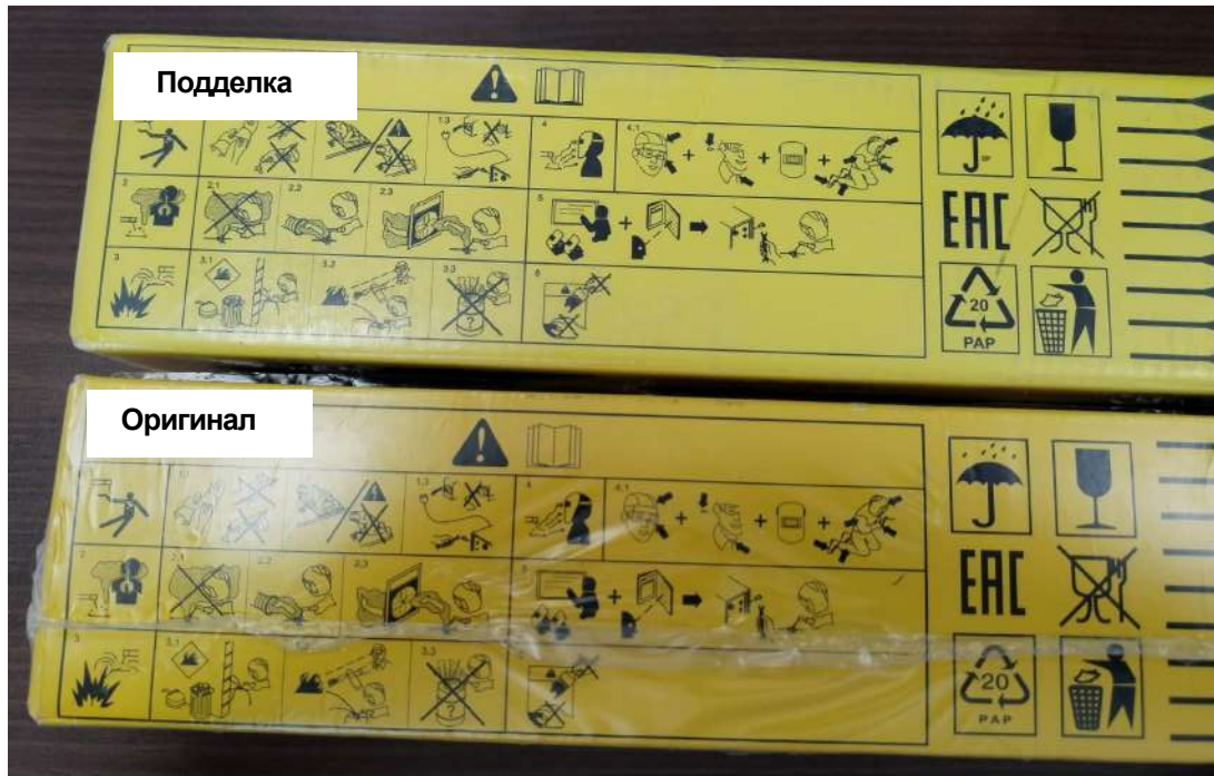
Оригинал (два термоусадочных шва)