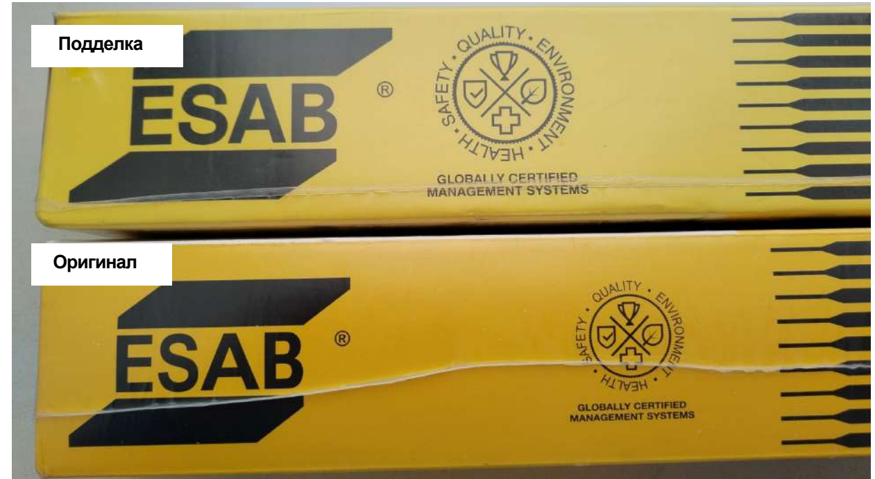
Подделка (один термоусадочный шов)