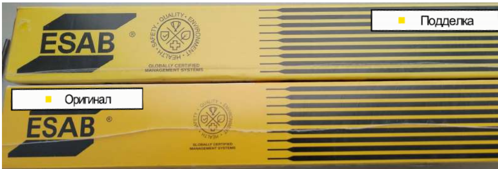
Оригинал (два термоусадочных шва)